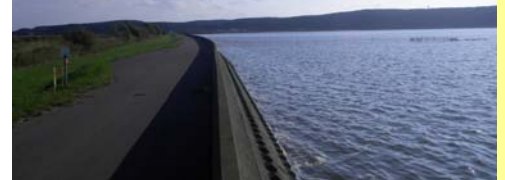
現在の状況 (2014. 1. 15撮影)